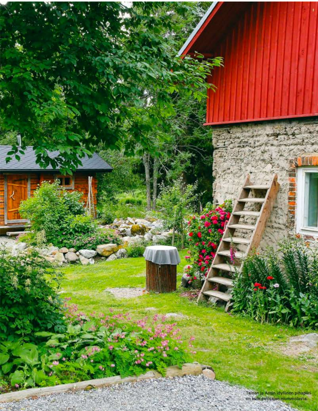
Tainan ja Antin idyllinen pihapiiri on kuin entisajan mummolasta.